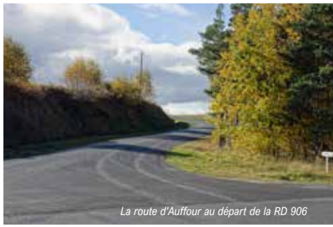
La route d'Auffour au départ de la RD 906