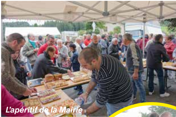
L'apéritif de la Mairie

Ils ont offert les frites et leur temps !