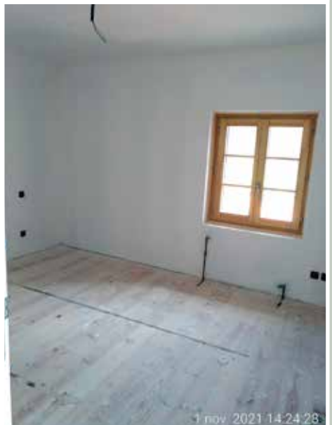
1 nov. 2021 14:24:28