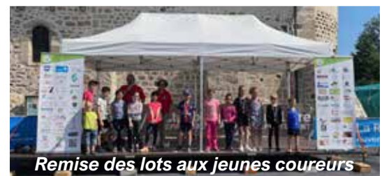
Remise des lots aux jeunes coureurs

Et tout au long de la journée, les visiteurs ont parcouru les stands du vide-greniers (33 exposants). Les enfants se sont régalés de gâteaux vendus au bénéfice de l'APE, et ont rivalisé de hauteur sur le trampoline mis à disposition par Camille de la Souchère.