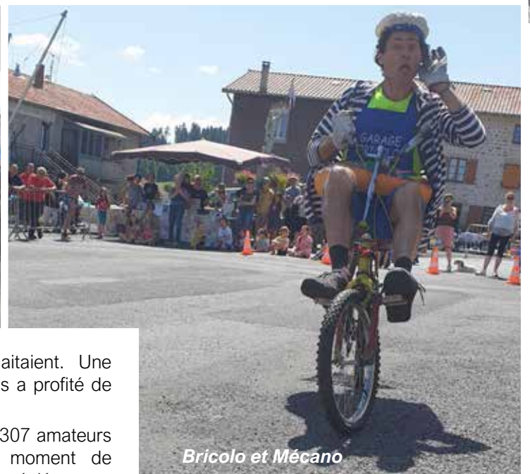
Bricolo et Mécano