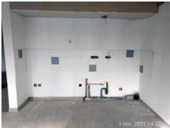
1 nov. 2021 14:22:53

Les travaux avancent bien et la livraison des appartements est envisagée pour fin mars 2022.