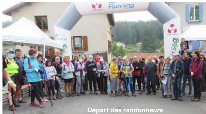
Départ des randonneurs