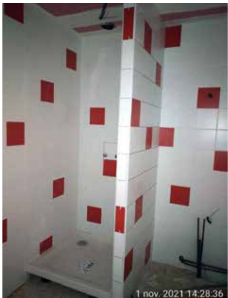
1 nov. 2021 14:28:36