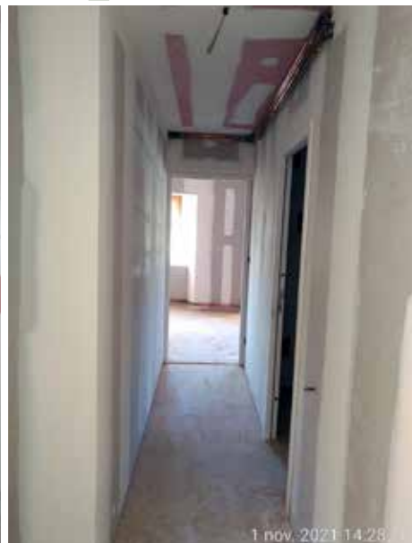
1 nov. 2021 14:28:36