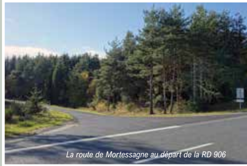
La route de Mortessagne au départ de la RD 906