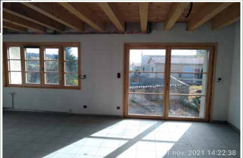
1 nov. 2021 14:22:38