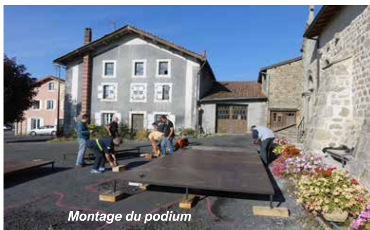
Montage du podium