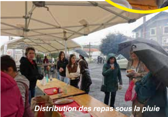
Distribution des repas sous la pluie