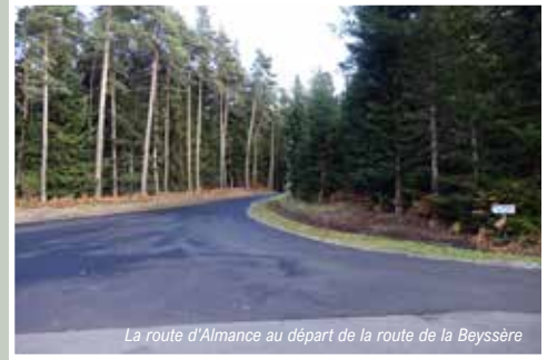
La route d'Almance au départ de la route de la Beysière

On vous l'avait annoncé, on l'a fait ! Fini les nids de poule sur ces routes !