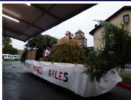
Le courage des jeunes du bourg à la Féria