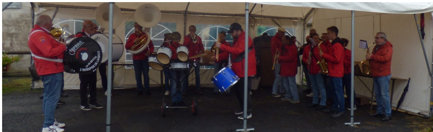
La fanfare « La Band'AMIDOS »