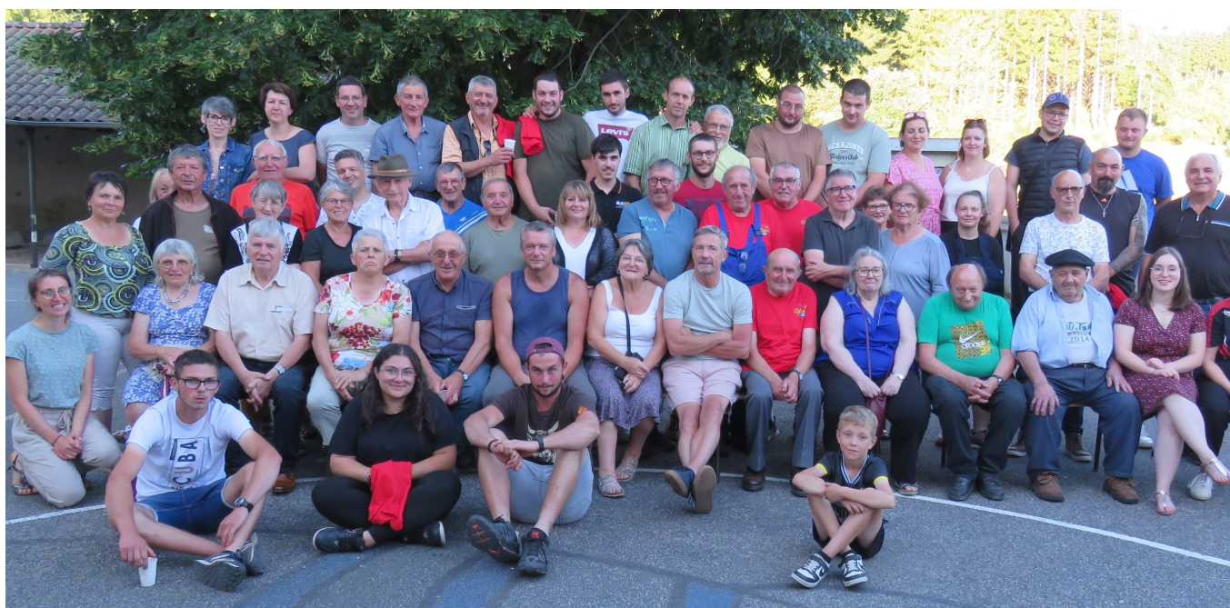
Tous les bénévoles sans qui rien ne serait possible

Durant le week-end du 20 juillet 2025, Félines a été dans une effervescence sans précédent. En effet, tous les compteurs des courses, randonnées, repas et caisses à savon ont surpassés les résultats de l'an dernier.