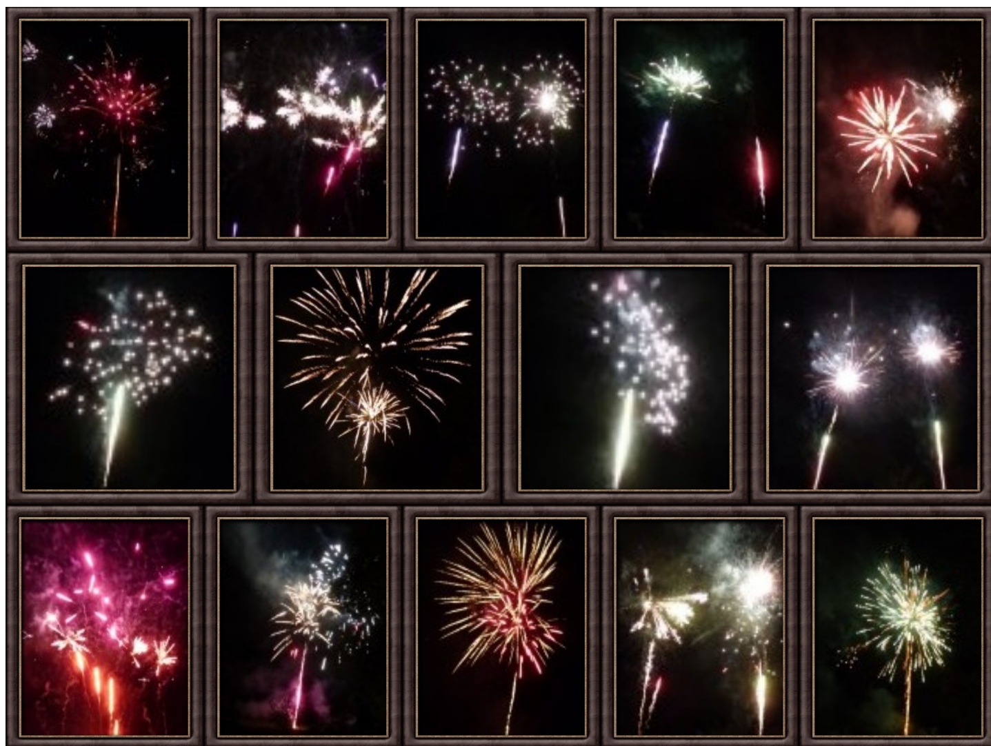
Le feu d'artifice, sous les yeux émerveillés des grands et petits enfants